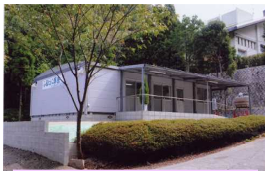
ふるたに葬祭東山会館