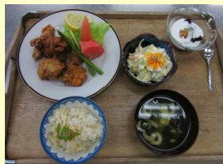
(本日の献立) タケノこご飯 鶏の唐揚げ ポテトサラダ 清汁