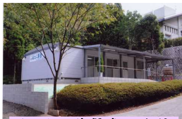
ふるたに葬祭東山会館