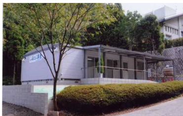
ふるたに葬祭東山会館