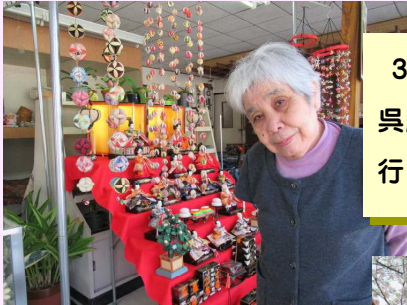
3月某日、近所のモリチカ呉服店さんに雛飾りを見に行かせていただきました。

4月初旬、今年も桜土手～道の駅に花見に出かけました。お天気にも恵まれ、満開の時期に出かける事ができました。桜の木の下で、お茶やおやつを召し上がられ、口々に“桜きれいじゃな～、今年も来れて良かった～”と、とても喜ばれていました。