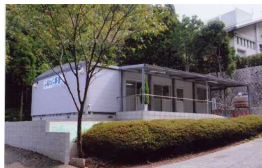
ふるたに葬祭東山会館