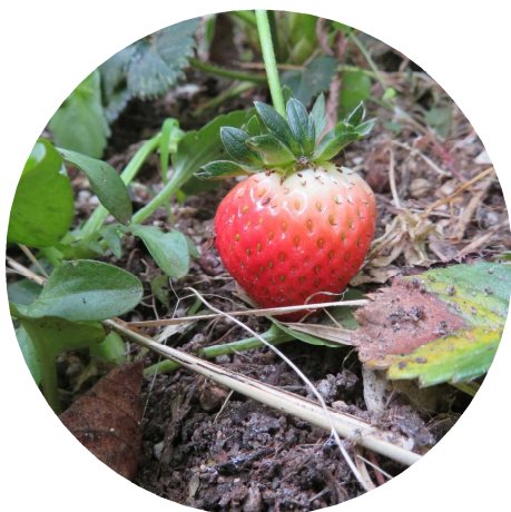
デイサービスミニミニ農園にイチゴがなりました。